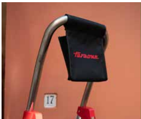
Wygodna i solidna kieszeń na narzędzia. Practical tool bag.