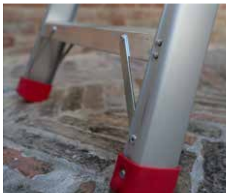
Mocowanie stopni z zastosowaniem technologii lotniczej oraz większa stabilność dzięki poprzeczkom wzmacniającym w narożnikach. Increased stability with reinforced crossbars on the corners.