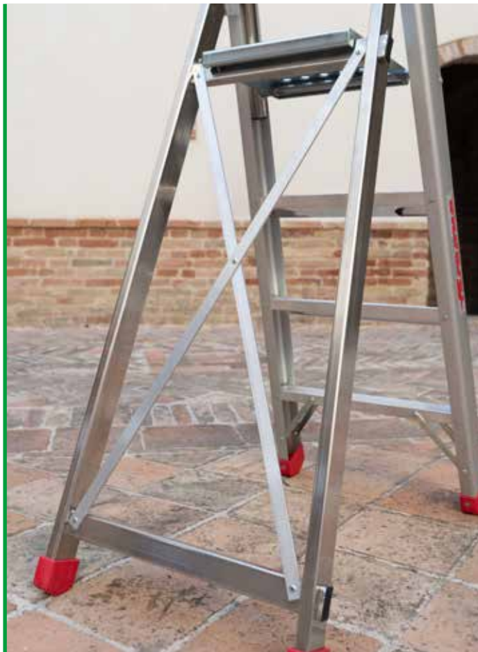
Krzyżowy system stabilizacji Cross-stabilising system.